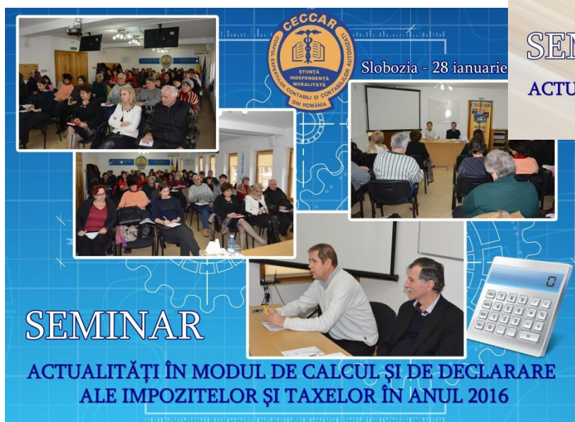
Slobozia - 28 ianuarie

În data de 30 ianuarie 2016, la sediul filialei s-a desfășurat într-un cadru festiv ceremonia de depunere a jurământului de către absolvenții examenului de aptitudini – sesiunea 2015. Emoționați,