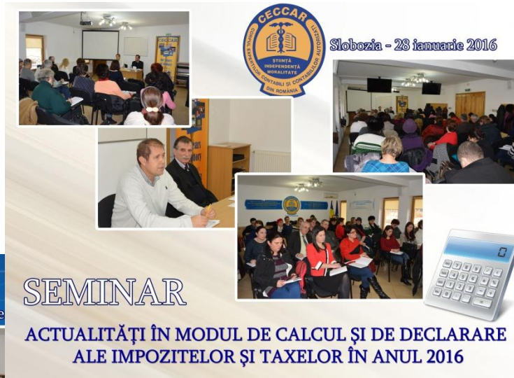
Slobozia - 28 ianuarie 2016

pentru care participanții au dorit să afle și opinia reprezentanților ANAF în teritoriu.